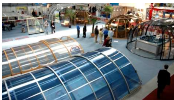
Ekspozycja IPC, 300m2, w Pradze, Czechy

Naszą rekomendacją jest pozytywny osąd specjalistów basenowych i publiczności na najważniejszych targach i wystawach w Europie i USA (Budma, Instalacje, Invest Hotel, Gardenia w Poznaniu, Aquabud w Gdańsku, Wellness w Krakowie, Spa w Łodzi, Pool Salon w Warszawie, targi w Lyonie, Paryżu, Salzburgu, Brnie, Pradze, Boloni, Mediolanie, Budapeszcie, Zagrzebiu, Wilnie, Odessie, Moskwie, Rimini, Tulln, Barcelonie, Las Vegas, Atlantic City, Orlando, Stuttgartarcie, Köln, Płowdiw, Hamburgu, Malmö, Almaty, Genewie, Brighton, Londynie, Reykjaviku, Montrealu i wielu innych)