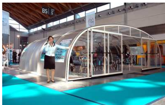
Udana wystawa w Rimini, Włochy