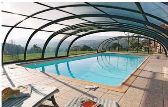
Obszerny model TROPEA